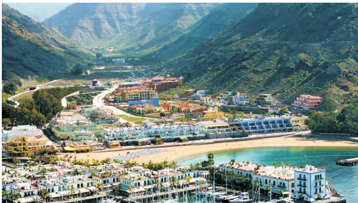
PUERTO DE MOGAN (GRAN CANARIA)

Pobyt na każdej z wysp będzie trwał 2-3 dni w trakcie których wypożyczymy wspólnie auto, rowery i będziemy mogli zobaczyć: