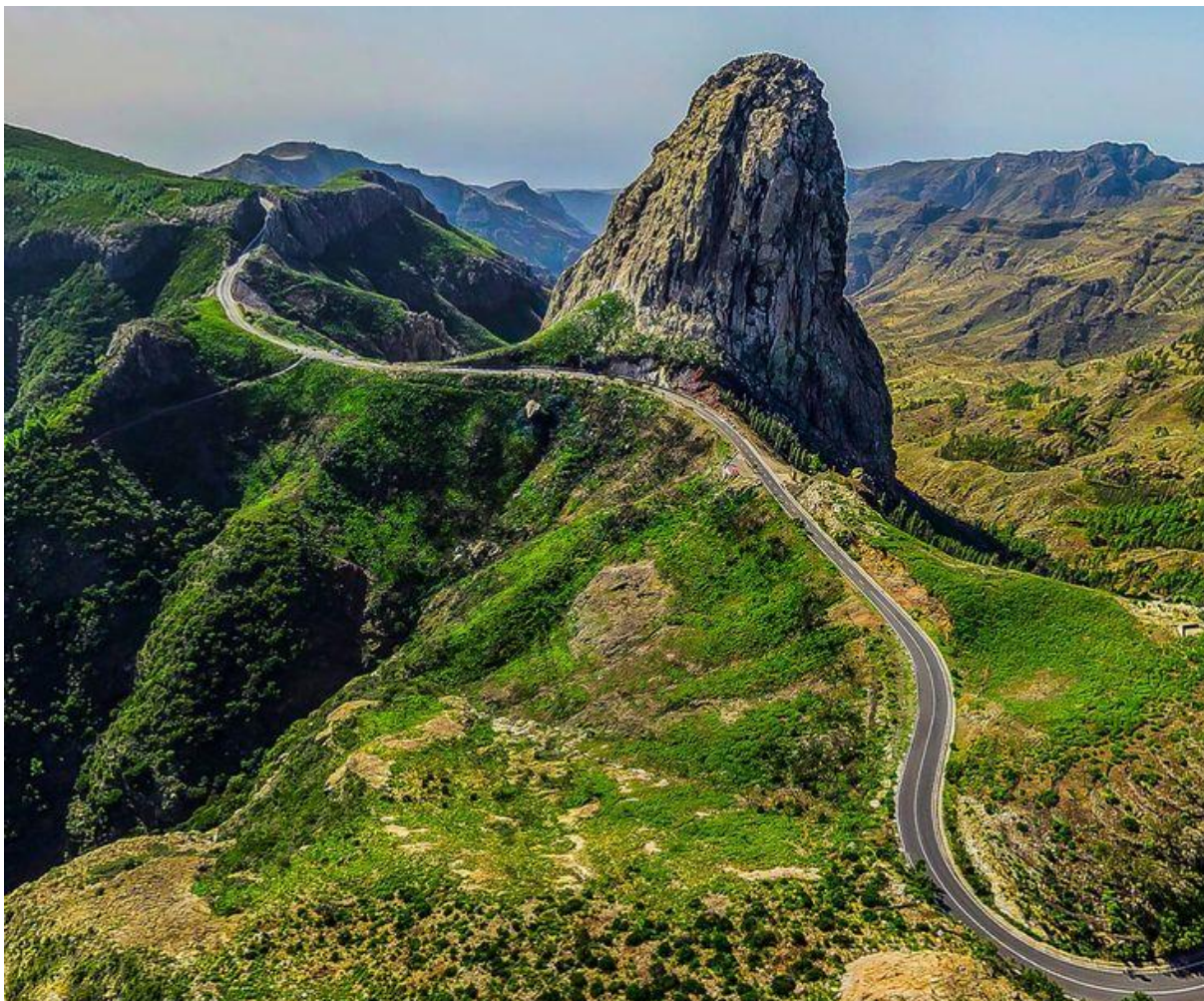
WĄWOZY LA GOMERY GDZIE POSŁUGIWANO SIĘ JĘZYKIEM GWIZDANYM