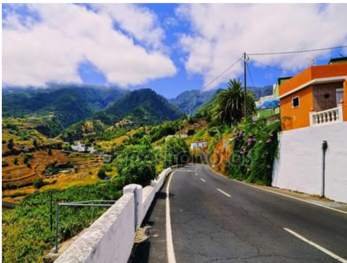
MIASTECZKO (LA PALMA)