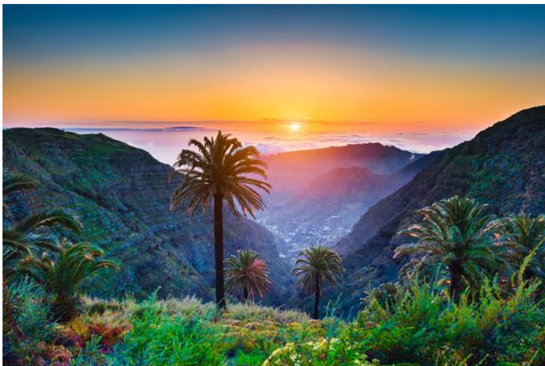
DZIKA WYSPA (ELHIERRO)