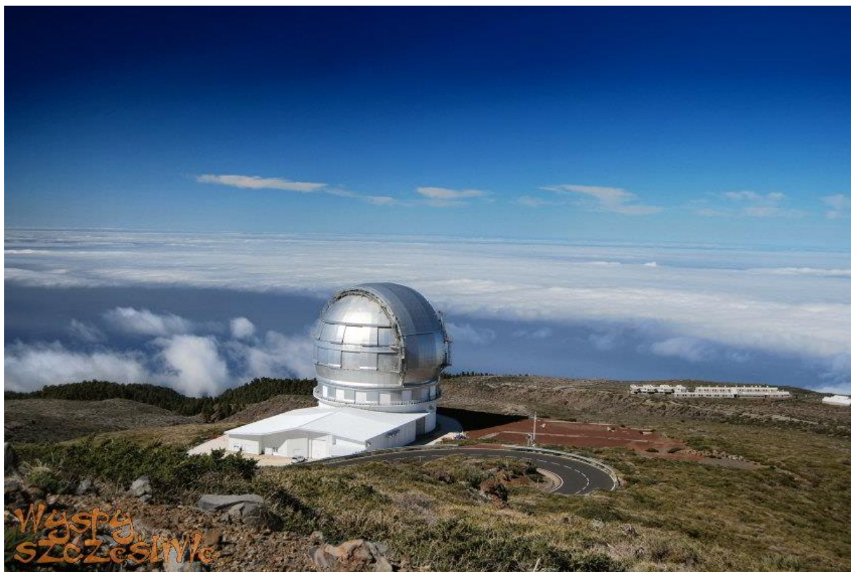
OBSERWATORUM ASTRONOMICZNE (LA PALMA)