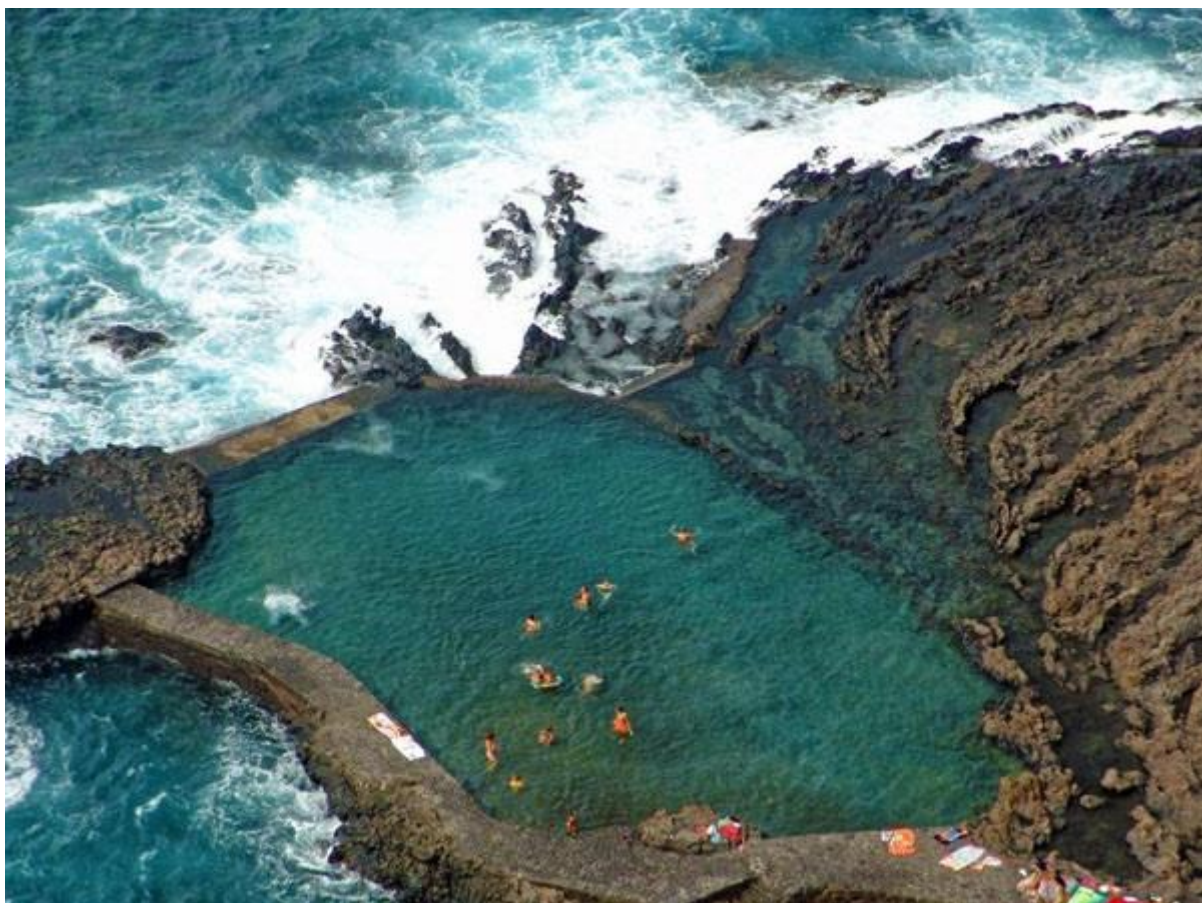
KĄPIELISKO ☺ (EL HIERRO)