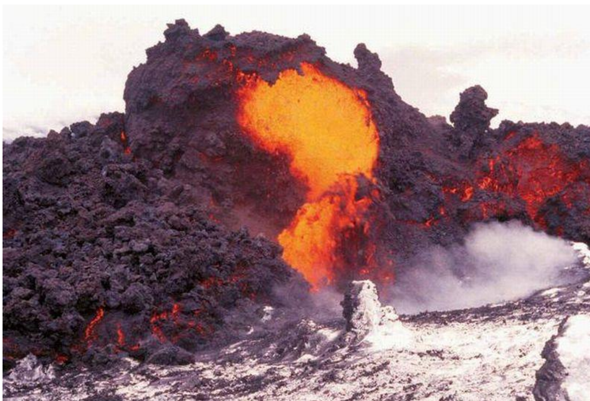
WCIĄŻ AKTYWNA WULKANICZNIE WYSPA (EL HIERRO)