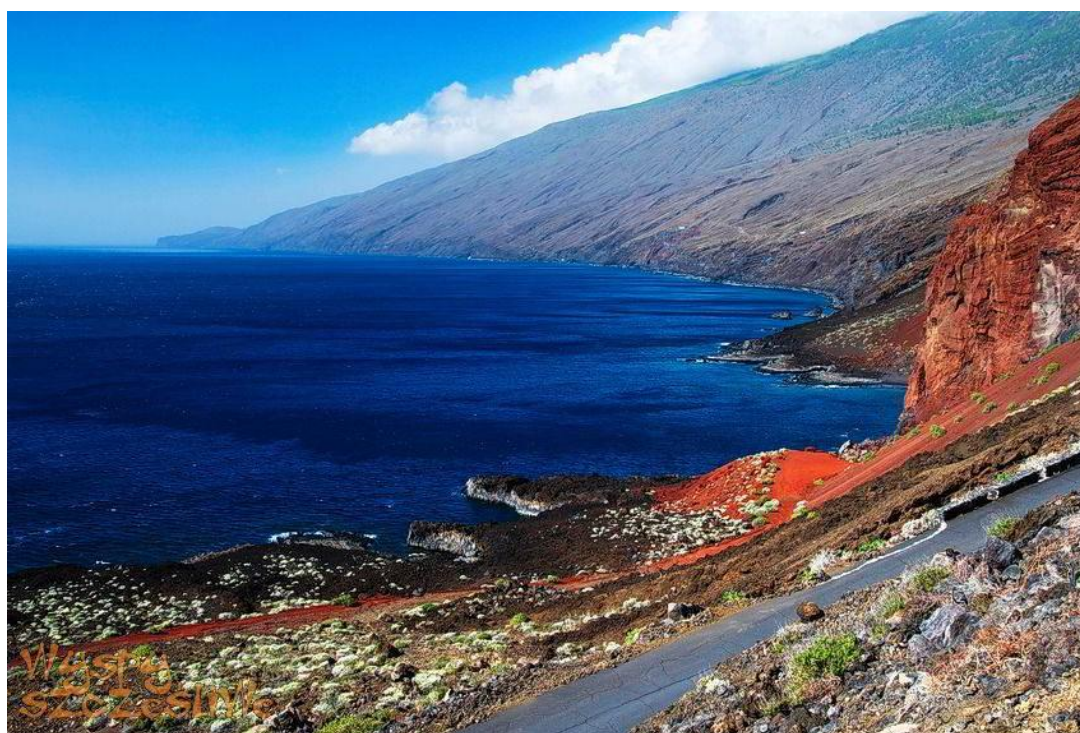
WYBRZEŻE (EL HIERRO)